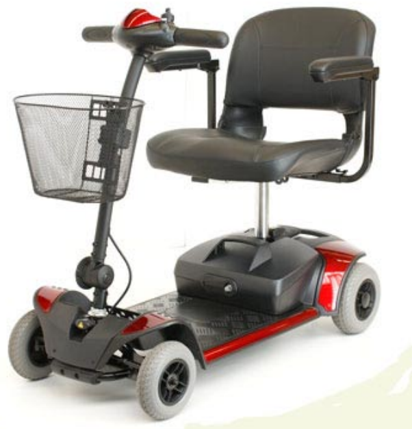
Elektromobil Vital Quickly 4

Funktion + Komfort + ausgereifte Technik